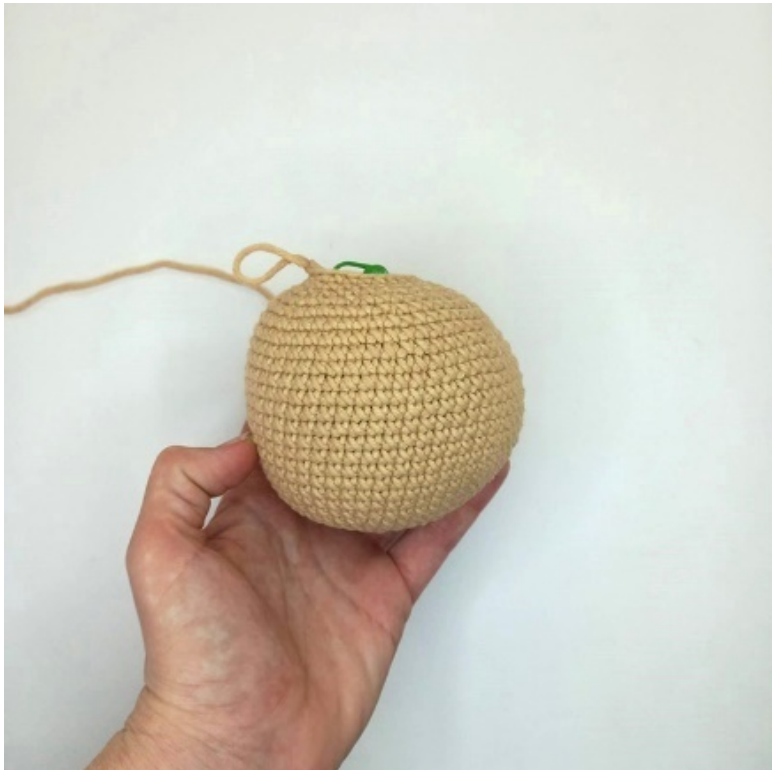
Фото 13. Вид сбоку