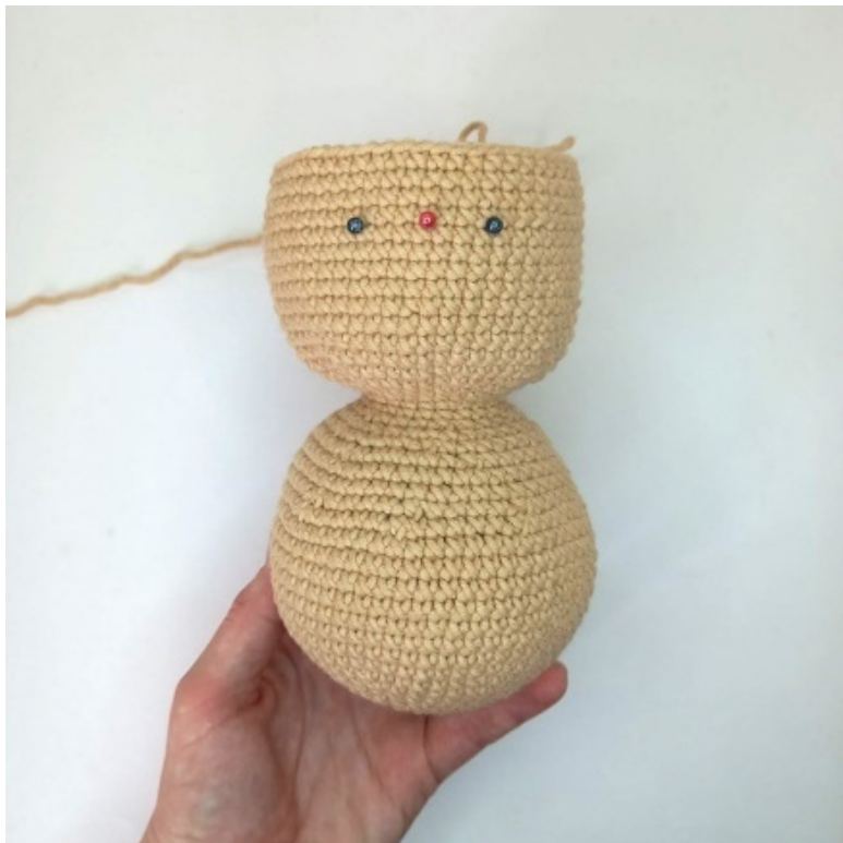
Фото 16. Намечаем с помощью английских иголок места расположения глаз