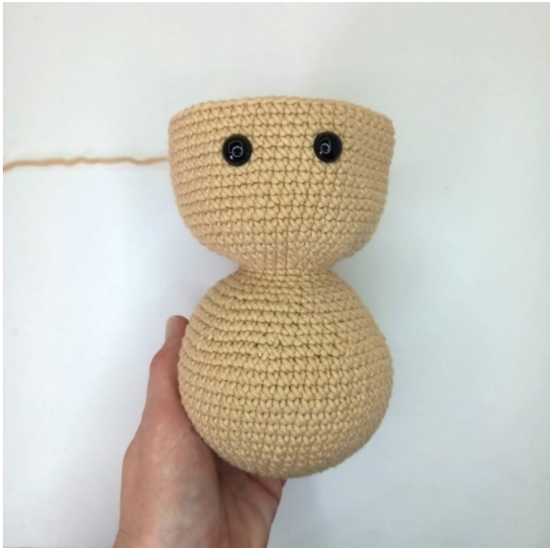
Фото 17. Здесь вставлены глазки 12 мм